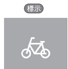
【自転車及び歩行者等専用】 【普通自転車歩道通行可】